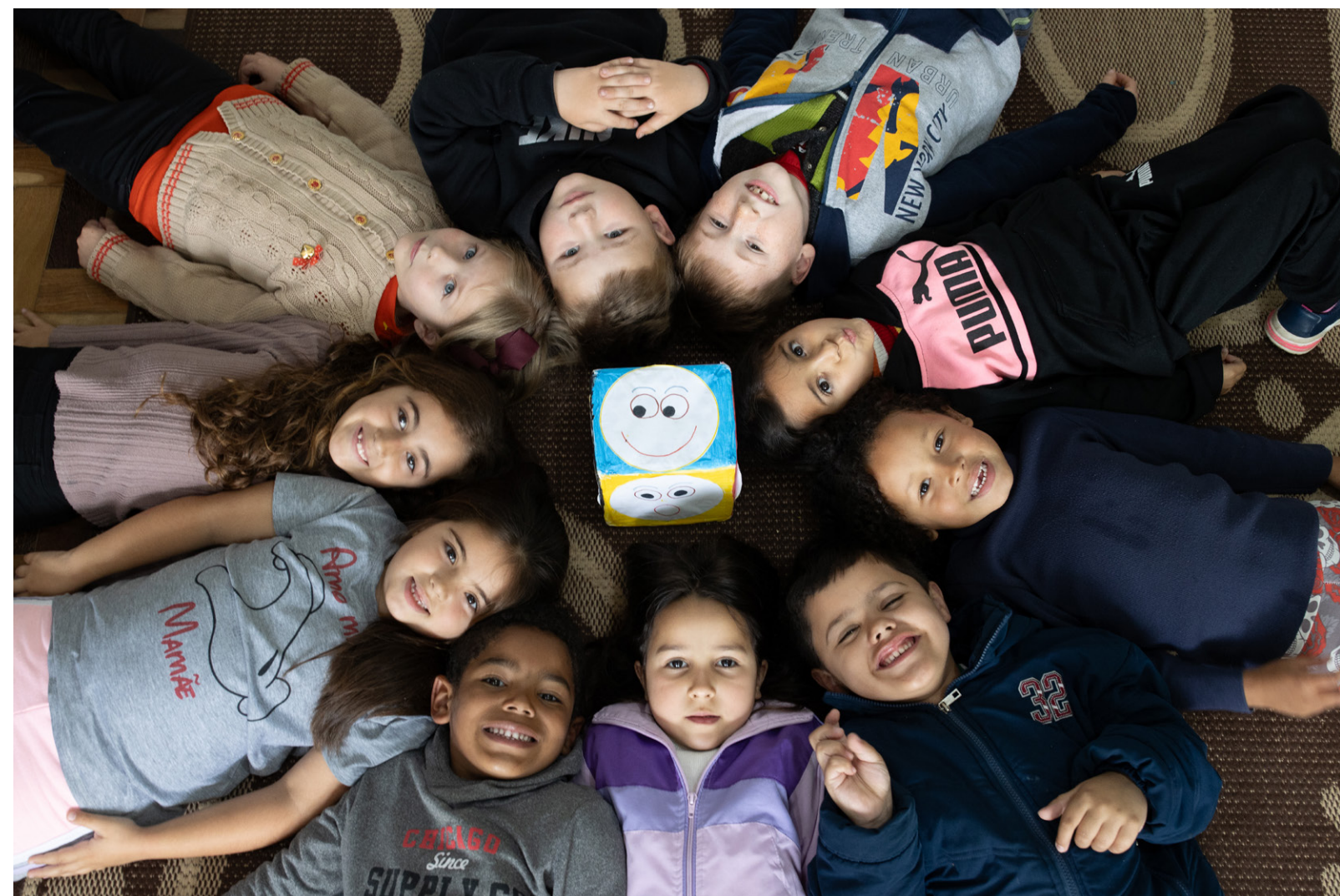
Projeto em Canguçu (RS) estimula crianças a nomear os sentimentos e a regular as emoções.

Formação de educadores: em 2023, entre os meses de março e junho, o projeto Alavancas conduziu a formação semipresencial de 394 cursistas, cuja carga horária foi de 120 horas. Ao longo de 12 videoaulas, professores e especialistas em educação inclusiva compartilharam um panorama completo - do histórico