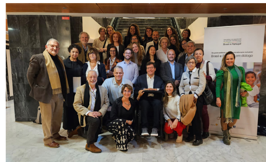
Especialistas em educação inclusiva de diferentes organizações do Brasil e de Portugal se reúnem em Lisboa para intercâmbio.